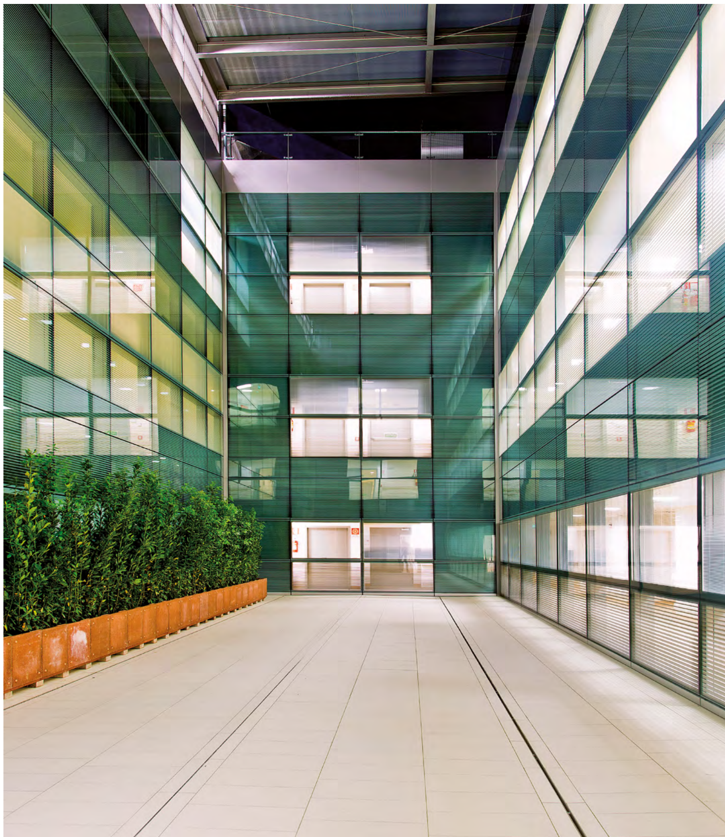
FLOOR: chambrod cm 30x60 - 11 3/4 "x23 5/8 "